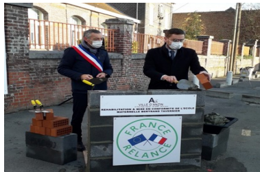
Le Secrétaire Général de la Préfecture du Nord, Simon FETET, au chantier de rénovation et de construction des nouveaux locaux de l'école Bertrand Tavernier d'Anzin.

- mise à l'honneur des dispositifs d'aide à l'apprentissage pour les personnes en situation de handicap par le témoignage d'un chef d'entreprise concerné, en présence de Cap Emploi.