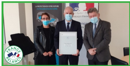
Le Préfet, Michel LALANDE, s'est rendu à l'entreprise FACAM Distribution à Neuville en Ferrain

Cette association bénéficie, au titre du plan de relance, du dispositif "Quartiers Solidaires", un fonds exceptionnel de soutien d'urgence de 20 millions d'euros à destination des associations de proximité, relais essentiels de l'action de l'État dans les quartiers prioritaires.